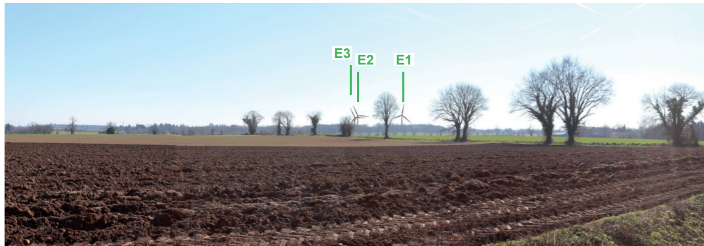
Photographie 102 : Perception depuis la D950 au nord de l'AER qui traverse de vastes étendues de champs cultivés (Vue 17 du carnet de photomontages).

Les boisements localisés au nord (bois de la Foye) et au sud (bois de la Garde et de Fréteveau) du projet éolien sont également des éléments structurants du paysage et souvent perceptibles depuis l'aire d'étude rapprochée. Le projet éolien vient s'adosser au boisement de la Foye. La perception du projet est donc généralement atténuée par ces ensemble depuis l'aire d'étude rapprochée.